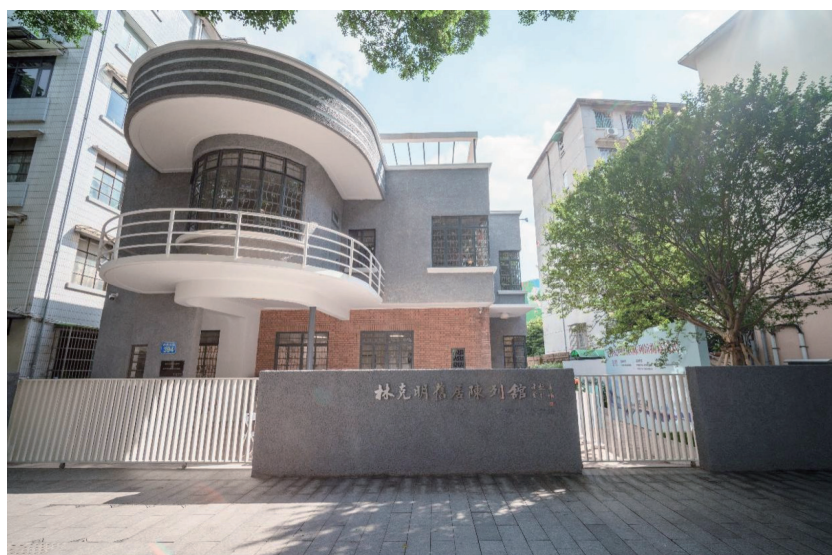
林克明旧居（林克明旧居陈列馆）

第三种是具有显著的“建筑艺术特征”。例如，代表一定时期建筑设计风格，或者建筑样式、建筑细部具有一定的艺术特色，或者为著名建筑师的代表作品，以及建筑材料、结构、施工工艺代表了一定时期的建造科学与技术，或者代表了优秀传统建造技艺传承的建（构）筑物。比如，由中国第一代建筑师林克明亲笔设计、以错层弧窗呼应东濠涌地势高差的现代主义宅邸，从私家旧居蝶变为城市记忆展厅的百年坐标——林克明旧居。它不仅是一座见证了广州近百年城市发展历程的历史建筑，更是岭南现代建筑探索的“教科书”，镌刻着本土建筑师跨越世纪的专业足印。