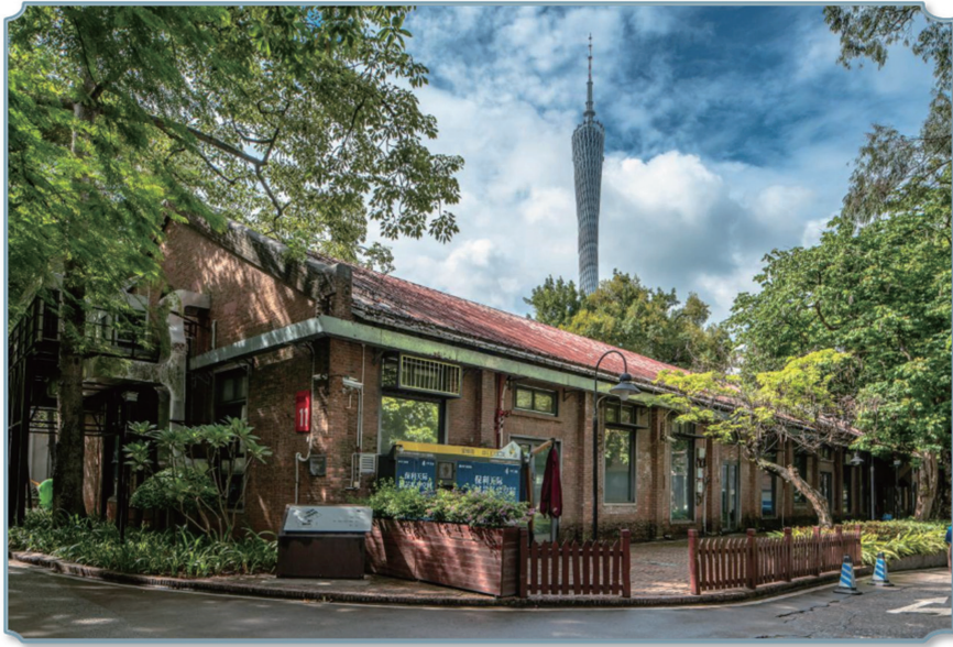
广州纺织机械厂旧址（广州T.I.T创意园）

第四种是具有强烈的“群体认同感”。例如，承载了一定时期历史记忆和情感，具有一定的群体心理认同感，记录一定时期社区居民的记忆和情感的历史文化片区，在一定地域内具有标志性、象征性，具有较强的群体心理认同感的建（构）筑物。比如，从展现解放初期纺织工艺流程与轻工业建筑特征的机械厂核心车间，到创造数百亿产值的微信全球总部与潮流时尚设计工坊——历史风貌区广州纺织机械厂旧址（T.I.T创意园），园区内有6栋历史建筑。它不仅见证广州轻工业的发展历程，更是广州城市更新的“活化石”，记录着老厂房与新经济共生共荣的产业传奇。